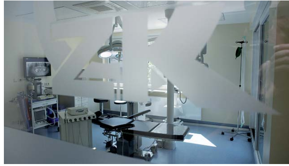
Auf eine weitere implantologische Spezialisierung ist die Praxis gut vorbereitet. Hier: der Eingriffsraum der ZK Zahnkonzept GmbH.

vergleichbaren Praxiseinnahmen ausgerichtet." Und mit einem Augenzwinkern fügt er hinzu: „Prima wäre auch ein Einnahmen-Benchmarking.“