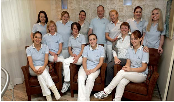
Für das Praxisteam stehen Professionalität und Respekt an erster Stelle.